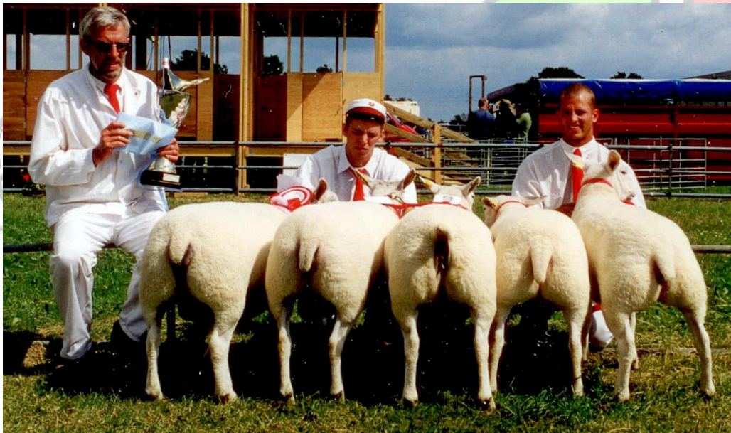
Bedste besætningsgruppe, Landsskuet 1999

Inden for besætningsgrupperne og afkomsgrupperne blev det til flere vindergrupper.