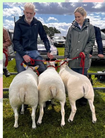
1-års samling uden lam (2024)