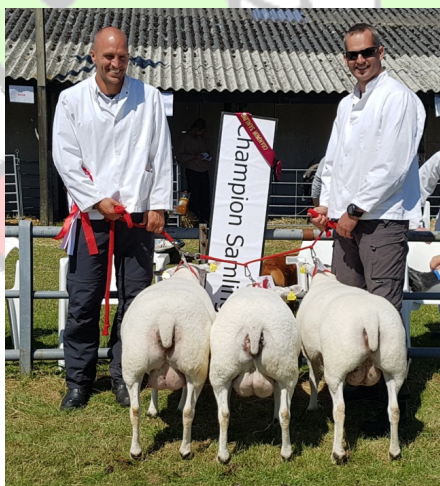
Ældre samling (2019)

Fra de seneste år kan især fremhæves samlingerne fra 2019 og 2024, der i de pågældende år blev udråbt som Landsskuets bedste samling på tværs af alle racer.