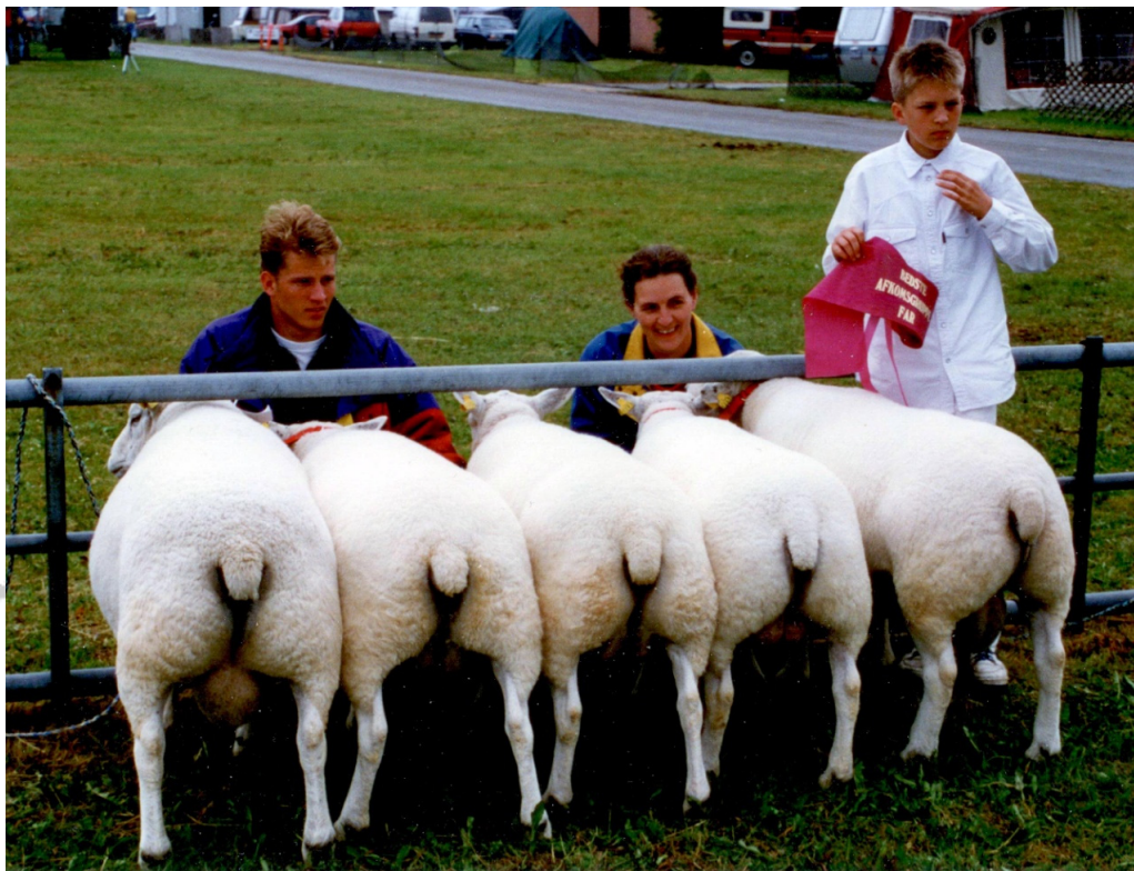
Fløjplads til afkomsgroupe efter Gambler, Landsskuet 1996

Som bekendt er der intet gelænder på tinderne. Engagement og præstationer i de følgende år kom da også til at ligge på et lavere niveau.