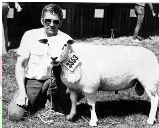
Talent, Ungskuet 1986

Ulmus, der blev indkøbt som vædderlam i 1986, levede i første omgang ikke op til sine forgængeres præstationer. Som 3-års vædder fik den dog i 1989 fløjplads og ærespræmie.