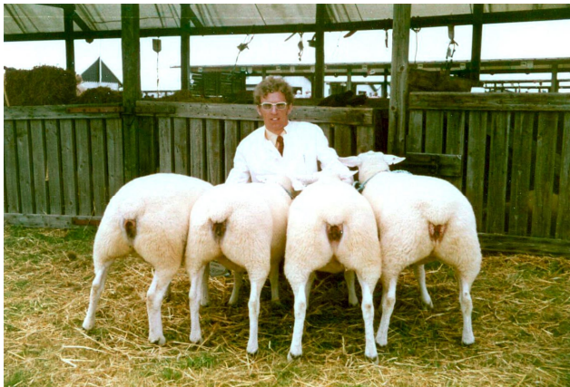
1-års samling, Ungskuet 1972

I 1972 blev succesen gentaget med en samling på 4 stk. 1-årige får, der ligeledes blev tilkendt 1. pr. 23 p. + ærespræmie. Der var dengang ikke var noget loft over, hvor mange dyr, der måtte være i en samling. Jeg husker bl.a. en Oxford Down samling med 8 stk. 1-års får.