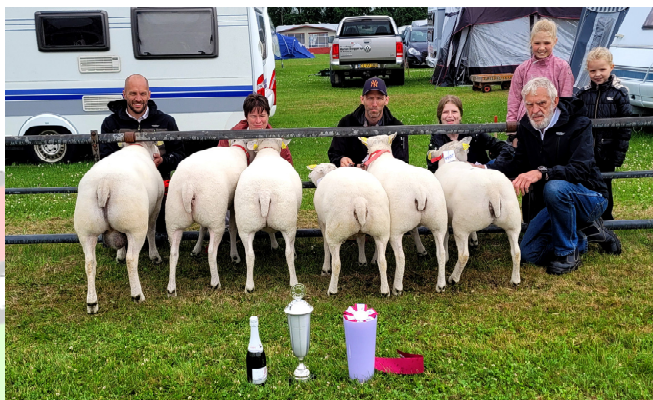
Afkomsgruppe fra 2022 efter 24252-00323 Christopher.

På Landsskuet er der en konkurrence på tværs af alle racer om skuets bedste afkomsgruppe efter en vædder. En afkomsgruppe består af alle de på skuet bedømte dyr efter den pågældende vædder, dog minimum 4 voksne dyr. Der er særlige vandrepokaler med indgravering af de enkelte års vindere tilknyttet den pågældende konkurrence.