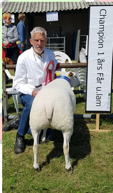
Får 61569-01391 (2019)

I 2023 havde hun igen succes som 5-årig og blev tilkendt en ærespræmie. Hendes lam (61569-01558) blev i 2023 tilkendt et championat som skuets bedste gimmerlam.