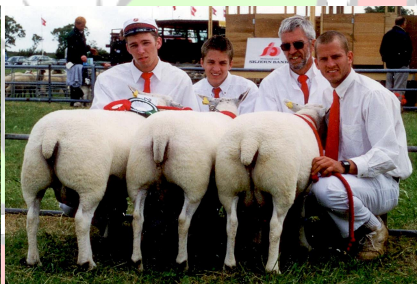
Samlinger af ældre får tilkendt 24 p. og ærespræmie, Landsskuet 1996 og 1999

I de pågældende år havde jeg samlinger af ældre får, der blev tilkendt 24 p. og ærespræmie. I de pågældende år var der tillige fløjpladser til 1-årige samlinger fra besætningen, og 1996-