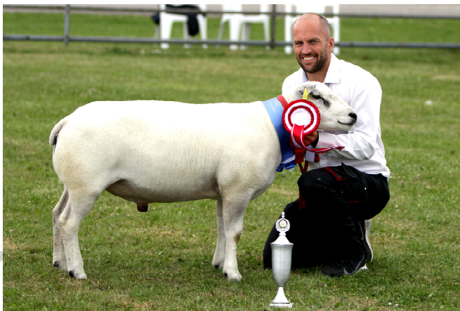
Lysnet Focus, 61569-01530 (2022)

Interbreed er en konkurrence, hvor de bedste dyr inden for de enkelte racer konkurrerer mod hinanden. Herved finder man skuets bedste dyr inden for de enkelte kategorier, som f.eks. ældre og yngre væddere samt ældre og yngre får. Vinderne får titel som Champion inden for de enkelte grupper.