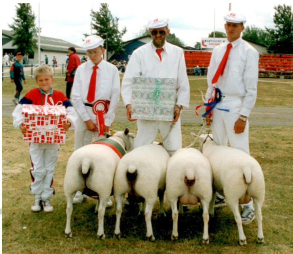
Fåret til venstre fik 24 p. og ærespræmie som bedste hundyr. De 3 øvrige fik 23 p. og ærespræmie, Landsskuet 1993

samlingen blev tildelt en ærespræmie. I disse år var det yderst sjældent, at 1-årige samlinger blev tildelt ærespræmie.