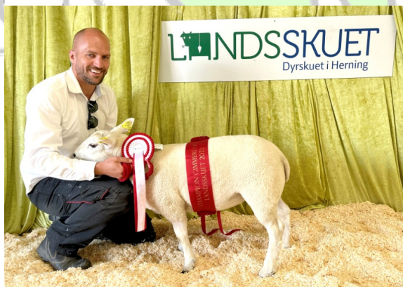
Gimmerlam 61569-01558 (2023)